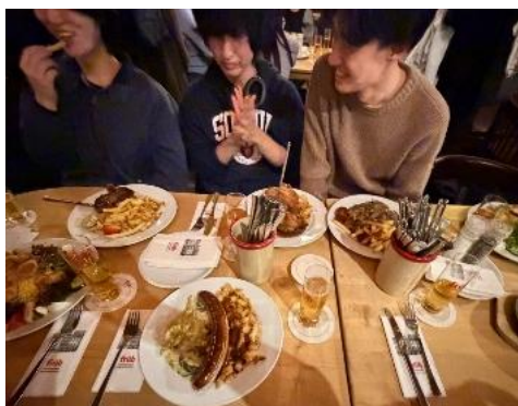
▲各国から来た留学生の仲間と

・ 留学先 ：デュッセルドルフは、日本人が約 7000 人住んでいる都市で日本食スーパー、日本食レストランが多数存在しており、日本人との遭遇率が高かった。