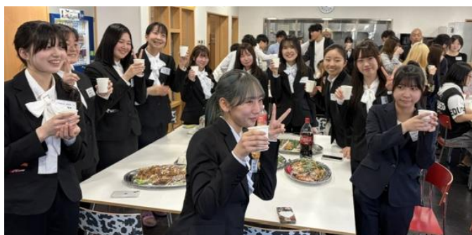
▲大学生活への期待などを語りあった