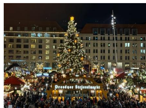
▲有名な Xmas マーケット

・ 得られた成果・学び ：主に 3 つあり、1 つ目は忍耐力。日本とは文化が違う環境で生活することは、ドイツの文化を受け入れることであり、そのためには忍耐力が必要であった。2 つ目は、問題解決能力で、留学中に困ったことが多くあったが、自分で行動を起こし、問題を解決できたことは、自信につながった。3 つ目は言語能力である。留学中には主に英語とドイツ語を使っていたが、留学初期に比べて、自然と言葉が出てくると感じるようになった。この留学で培った忍耐力、問題解決能力、言語力を活かして、グローバルに活躍できる人材になれるように頑張りたい。