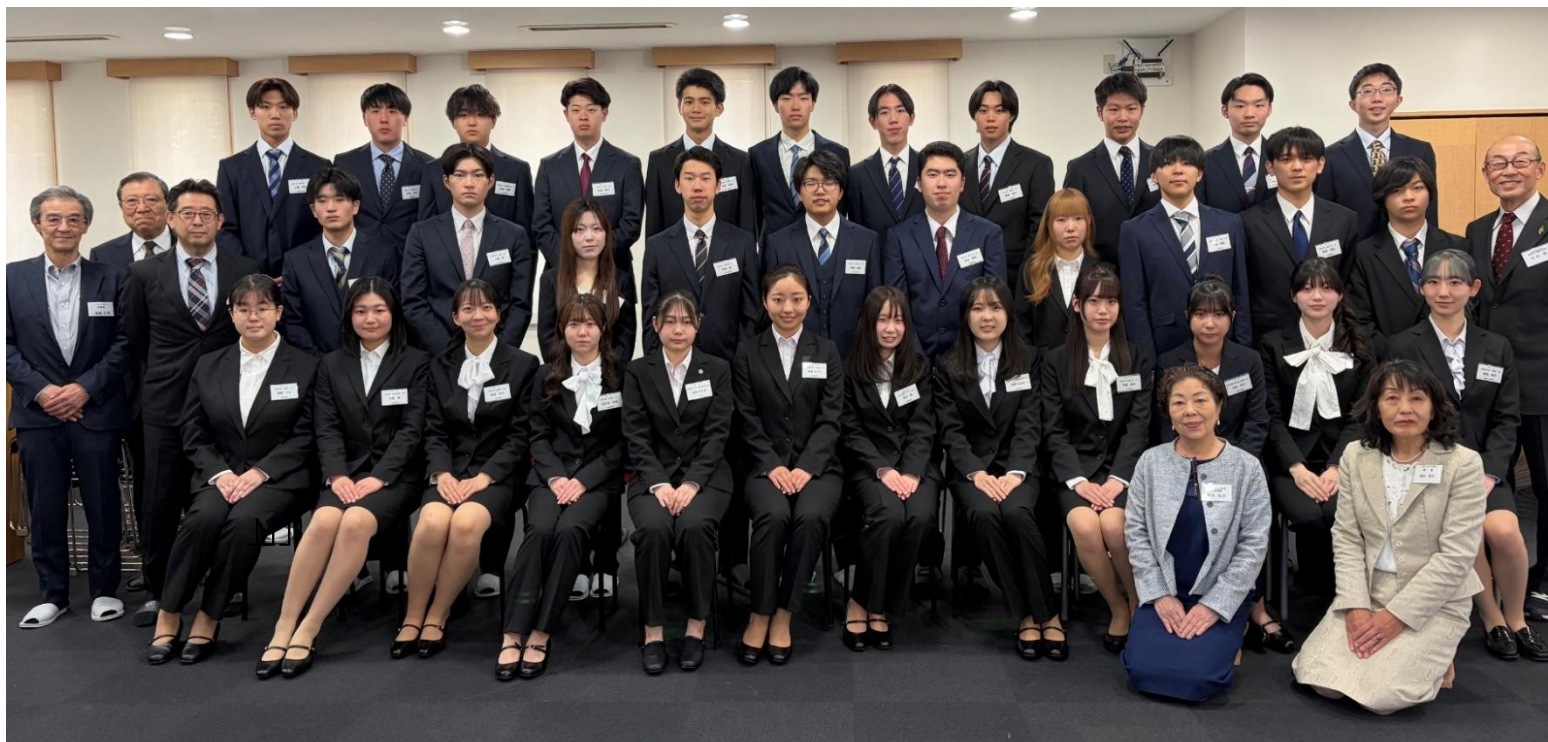
▲理事・役員とともに新入寮生が勢ぞろい

今年は、2倍を超える応募者の中から選抜された活気あふれる34名が全県下から入寮してきました。4年生が去り、ちょっと静かになった駒込や板橋の学生会館がパッと明るくなったようです。その澁漉とした若人を迎える「新入寮生歓迎会」が4月12日（日）駒込学生会館で開催されました。