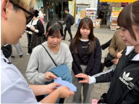
▲トランプを引いて食事の班分け

こうした配慮も長く続けられている行事だからだと寮監は感心したところ。1人の不明者を出すこともなく着いた新宿駅で夕食。時間は午後7時過ぎ。班分けをし新たなグループで自己紹介をしながら栄養補給をしましたが、ここでも上級生が費用を持つ大人の対応が見られました。