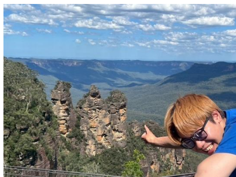
▲世界自然遺産のブルーマウンテン、スリーシスター