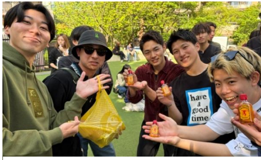
▲コース途中でOBが待ち受け、気付け薬を差入れ